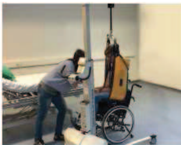
Enkel forflytning fra seng til stol