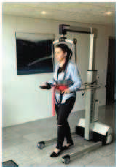
Gålift til genoptræning

Multilift 550 sørger for et stabilt og sikkert træningsmiljø for såvel patient som terapeut.